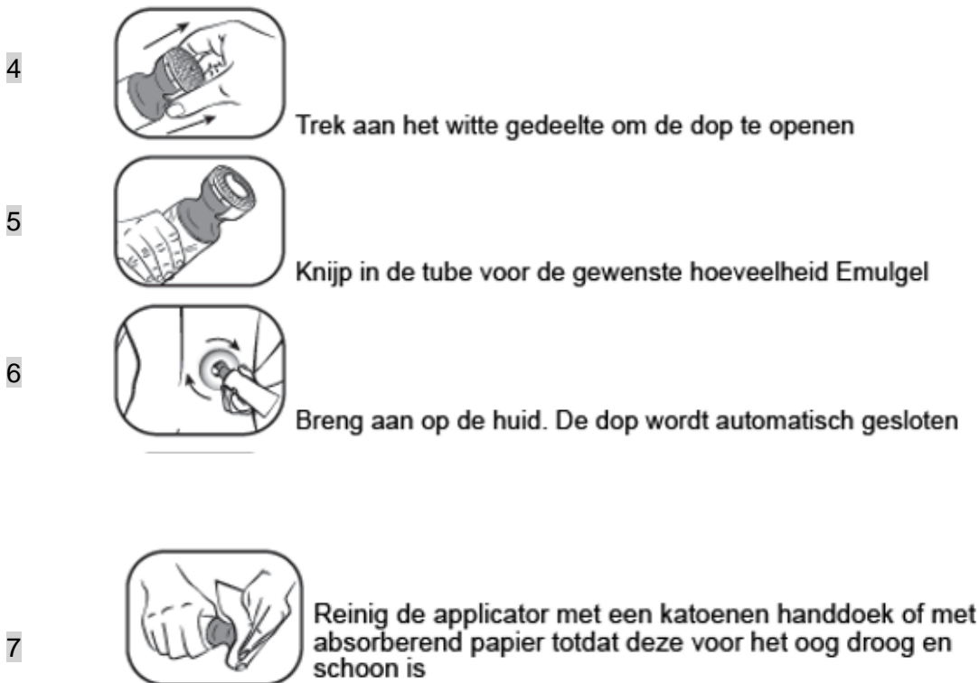
Figuur 2: Doseer- en smeerdop instructie stap 4 t/m 7

Gebruik de applicator niet opnieuw voor een andere tube. Volg bij het weggooien van de tube de in uw land geldende regels voor het weggooien van medicijnen.